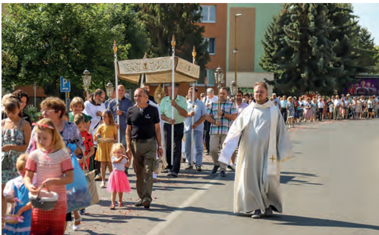
V nedeľu dopoludnia sa uskutočnili slávnostné sväté omše a procesia, ktorá oslovila mnoho návštevníkov.