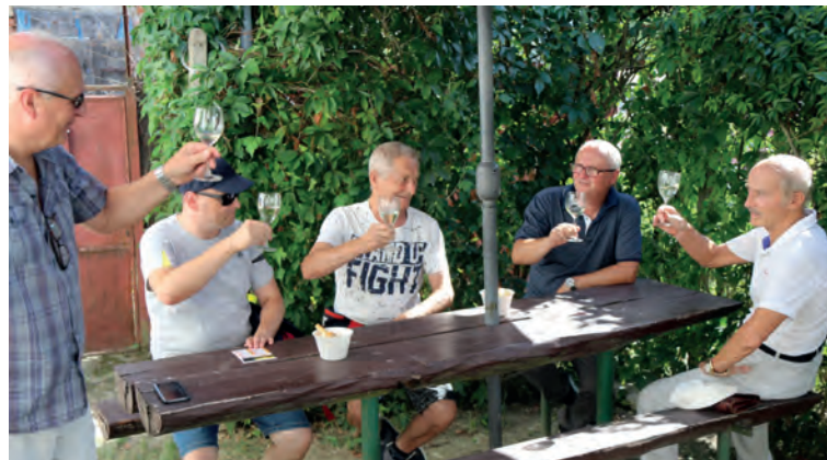
Tradičiou festivalu je okrem kultúrnych zážitkov aj Deň otvorených pivníc, kde sa návštevníci môžu stretnúť s vinármi mesta a vychutnať si miestne vína. O podujatí bol veľký záujem.