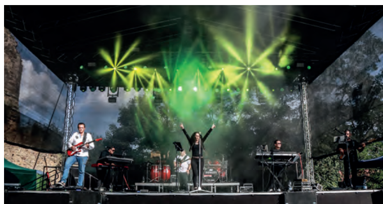
Sobotňajšie poobedie na hradnom nádvorí pokračovalo koncertom miestnej skupiny Infinity Music Band, ktorá hrala slágre známej maďarskej skupiny Neoton Família.