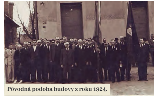
Pôvodná podoba budovy z roku 1924.

Dnes nenápadne vyzerajúca koncertná sála má za sebou bohatú históriu. Postavili ju v prvých rokoch 20. storočia a bola prvým kultúr-