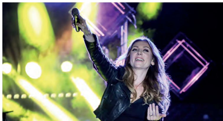
Piatkový večer sa niesol v znamení pocitov a dobrej hudby vďaka maďarskej speváčke Rűzsza Magdi. Zazneli piesne aj z albumu Karma, ktoré so speváčkou spolu spievalo aj občianstvo.