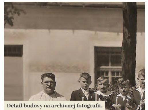
Detail budovy na archívnej fotografii.

nym stánkom v meste. Slúžila tiež ako sídlo Fil'akovského katolíckeho čítacieho a tovarišského spolku, počas prvej svetovej vojny ju využívali ako ošetrovňu zranených. Do roku 1936, kým nepostavili prístavbu k redute Vigadó, bola jedinou divadelnou sálou v meste. Neskôr v nej fungovalo gymnázium, počas nedávnej minulosti slúžila ako koncertná sála základnej umeleckej školy.