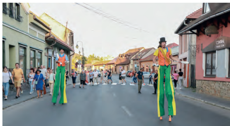
Po divadle bol pre záujemcov pripravený chodúľový sprievod so skupinou Tűzfészek Társulat, ktorý viedol až po Podhradskú ulicu.