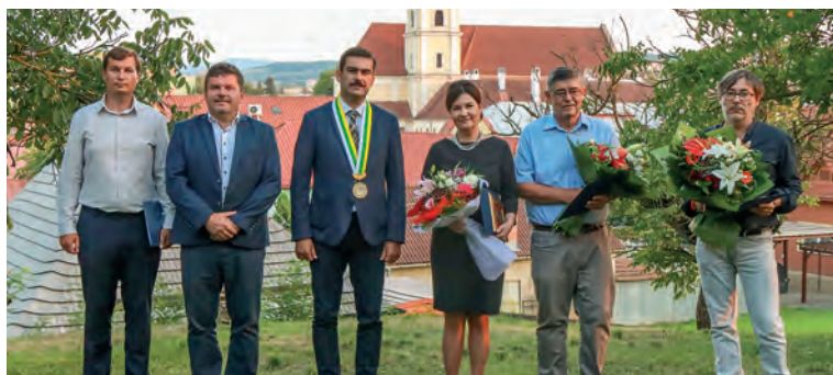
Ocenení (okrem Šimkoviča) so zástupcami mesta.

Počas osláv Dní mesta a Palácových dní samospráva Filakova už tradične udeľuje oceneným Ceny mesta a Ceny primátora mesta. Inak tomu nebolo ani v tomto roku, kedy si ceny prevzali štyria laureáti. Poslanci odhlasovali udelenie cien osobnostiam zo školskej a športovej sféry, primátorské ceny putovali do rúk zástupcom vedeckej a literárnej obce.