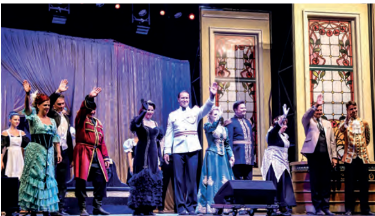
Trojdnový festival ukončila opereta v podaní divadla Rátanyi Róbert Színház pod názvom Sybill. Veľkolepé operetné predstavenie pod hradom zostane všetkým návštevníkom nezabudnuteľným zážitkom. Text: MsKS