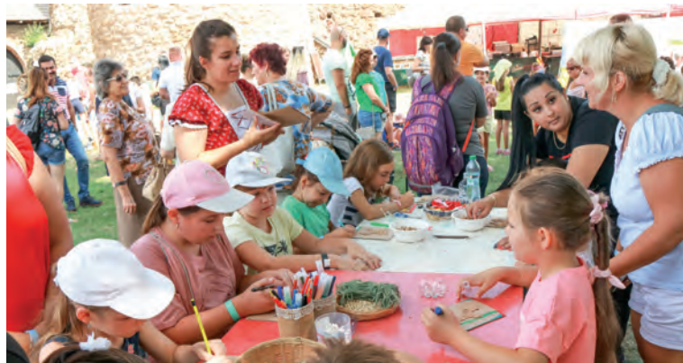
Sobotňajší deň otvorilo Rodinné predpoludnie. Okrem divadelných predstavení čakali detské publikum aj sprievodné aktivity ako drevené ľudové hry, dobový kolotoč, tvorivé dielne a megabubliny. Divadlo Portál pripravilo detektívnu rozprávku pod názvom Cáry máry alebo záhada strateného prűtika.