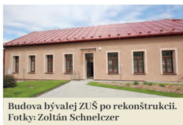
Budova bývalej ZUŠ po rekonštrukcii.

V dennom stacionári sa poskytuje pomoc pri odkázanosti na sociálnu službu, sociálne poradenstvo (aj pre rodinu klienta), sociálna rehabilitácia a ostatné plnenia spojené s poskytovaním tejto služby. V budove sú priestory vyčlenené na záujmovú činnosť, oddychové miestnosti vybavené posteľami, hygienické zariadenia i vonkajší dvor s lavičkami. Vchod je bezbariérový. Organizá-