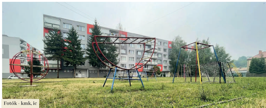
Fotók - kmk, ic

Sok önkormányzatnál aktuális téma volt a politikai rezsim alatt épült városi lakótelepek környékének felújítása, mivel már nem felelnek meg a mai kor követelményeinek. Füleken az elmúlt években a következő elemek felújításába investáltak a legtöbbet: utak, új parkolók, óvodák felújítása, valamint új lakótelepi játszótérek. Legújabbán az önkormányzat az elérhető támogatásokból a város központjában található lakótelepi bérházak közötti közterület komplex újjáépítését szeretné megvalósítani.