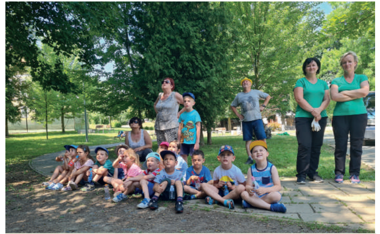
V piatok 25. júna predpoludním mesto pripravilo program pre deti miestnych základných a materských škôl. Boli svedkami vysádzania duba červeného a orezávania stromov horolezeckou technikou.