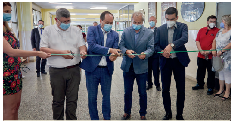
Vedenia školy, župy a mesta spoločne odovzdali dielne do užívania.

„Na skladovanie príslušenstva k strojom sme zabezpečili automatický sklad s úložnou plochou 105 metrov štvorcových a všetky dielne prešli rekonštrukciou podlahy. Tieto investície výrazne posunuli úroveň vzdelávania na našej škole a aj vďaka nim a duálnemu vzdelávaniu sa naša škola stala od 12. mája tohto