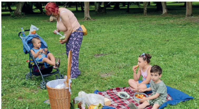
Pre rodiny bol pripravený piknik v sprievode živej hudby, hladkanie zvierat, možnosť vypožičať si knihy a časopisy či športové a spoločenské hry.