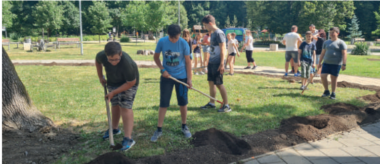
Spolu s pracovníkmi mestského záhradníctva deti vysadili ružový a levanduľový záhon.