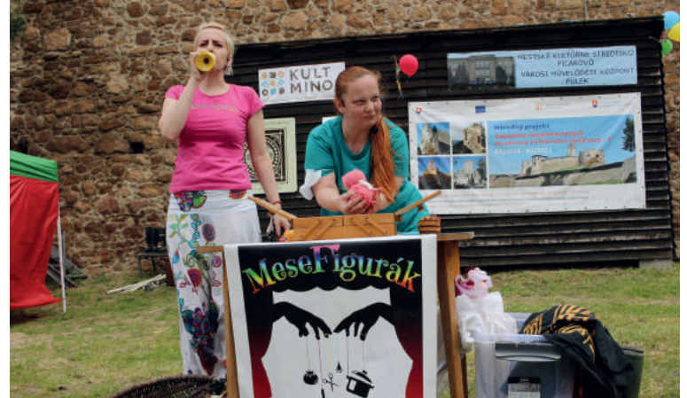
Bábkové divadlo MeseFigurák predviedlo interaktívne predstavenie v maďarskom jazyku. Pri spracovaní rozprávok použili svoj obvyklý humor a kreativitu.