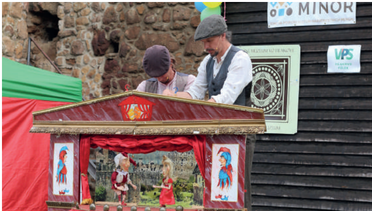
Bábkové divadlo Divadlo z Domčeka predstavilo rozprávku Ako sa Gašpar takmer kráľom stal. Herci hrali s tradičnými bábkami, vďaka čomu bolo predstavenie ešte zaujímavejšie.

V sobotu 5. júna Mestské kultúrne stredisko vo Fiľakove usporiadalo Mestský deň detí. Keďže stále platia obmedzujúce opatrenia, na tejto udalosti sa mohlo zúčastniť len 250 osôb. Tento rok sa kvôli opatreniam nemohli uskutočniť ani sprievodné akcie, ktoré robia deň detí ešte krajším a zábavnejším. Aj napriek takýmto nevýhodám rodiny neváhali a prišli sa pozrieť na jednotlivé detské divadlá. O zábavu sa postarali Divadlo z domčeka, MeseFigurák a Paramisi Társulat. Každé predstavenie malo svoje čaro. Niekomu sa páčili tradičné bábkami, niekomu spev a očarujúca hudba. Hradné nádvorie ožilo smiechom a dobrou náladou detí. Realizáciu podujatia finančne podporil Fond na podporu kultúry národnostných menšín.