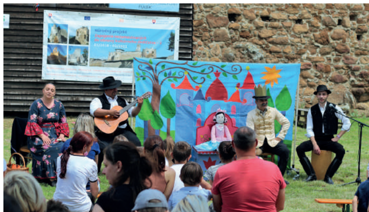
V záverečnej časti programu vystúpilo divadlo Paramisi Társulat. Vo veselej hudobnej úprave zahrali maďarskú ľudovú rozprávku Strom siahajúci do neba.