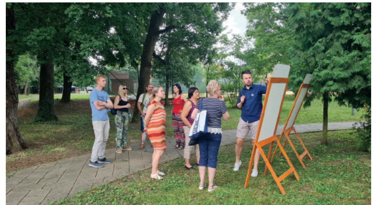
Program sobotného predpoludnia bol určený pre širokú verejnosť. V rámci prednášok sa návštevníci dozvedeli viac o histórii, hodnotách i budúcnosti parku.