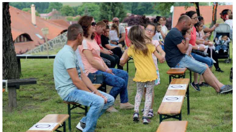
Detské obecenstvo si užilo zábavné programy, no i rodičia so záujmom pozerali predstavenia a dobre sa zasmiali na niektorých scénach. Text a foto - MsKS