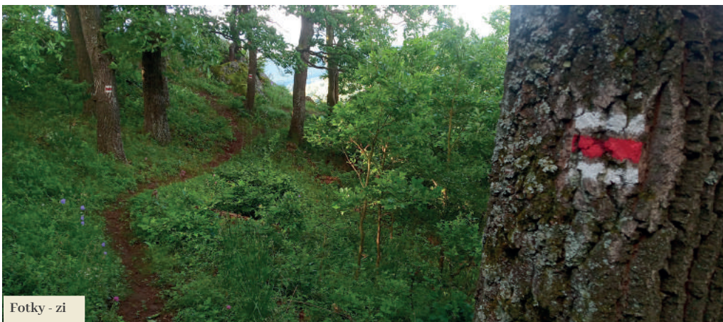
Fotky - zi

prípade má výhodu autobusové spojenie oproti osobnej doprave, v prípade ktorej sa musíte vrátiť tam, kde ste túru začali. Tí, ktorí majú radi dlhšie prechádzky, majú skvelú možnosť vyraziť z Filakova po žltej značke smerom na Belinské skaly, Monicu, a neskôr zo sedla Monica pokračovať po červenej značke na sedlo Garád a Pohanský hrad. Po zdoľaní 17 km dobre padne oddych, môžeme spoznať miesto a pokochať sa výhľadom až na najvyššie pohoria Maďarska – Bükk a Mátra. Cieľovými bodmi, ako vyššie uvádzame, môžu byť Šurice a Hajnáčka po zelenej trase, alebo Stará Bašta po náučnom chodníku. Do Filakova nás dopraví autobus na linke Tachty – Filakovo cez vymenované obce. V prípade, že preferujete vlakovú dopravu, je vhodné zísť do Šuríc, odkiaľ je vlaková zastávka Hajnáčka len 20