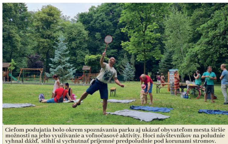
Cieľom podujatia bolo okrem spoznávania parku aj ukázať obyvateľom mesta širšie možnosti na jeho využívanie a voľnočasové aktivity. Hoci návštevníkov na poludnie vyhnal dážď, stihli si vychutnať príjemné predpoludnie pod korunami stromov.