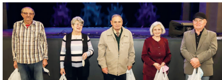
XVI. Generációk találkozója és a Jubilánsok köszöntése.