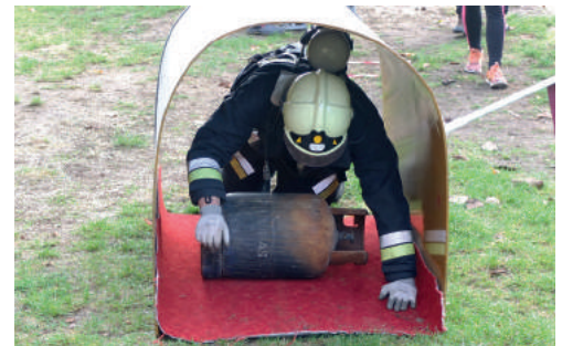
A megerősítő verseny többféle feladtból állt, mint például a tömlőkkel való munka, fűrészelés, alagúton való átjutás, vagy létra cipelése, s mindez nehéz bevétési ruházatban és légzőkészülékkel. A pálya az alsó várudvaron kezdődött és a középső várnál ért véget.