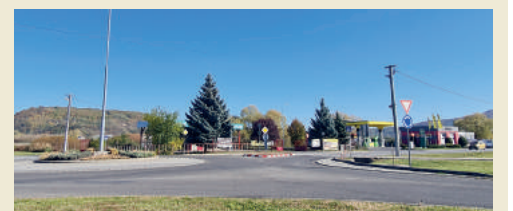
A Hulita Vilmos utca az FTC-stadion mellett jön létre.