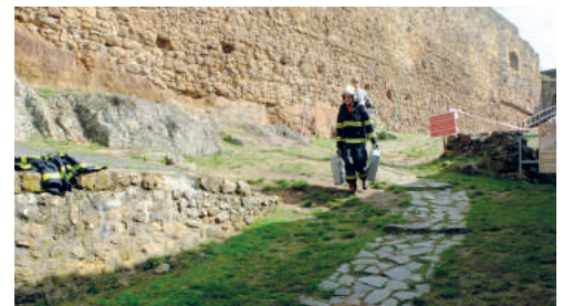
Az ideai próbatétel különösen nagy kihívást jelentett, mivel a hagyományos két versenypályaszakaszt most összevonták, így a tűzoltók nem pihenhettek meg útközben.

Október első hétvégéje a tűzoltók küzdelmének jegyében telt. Egy év megszakítás után ismét megszervezték a várban a Nógrád Tűzoltója elnevezésű versenyt, immár 4. alkalommal. 30 hivatásos illetve önkéntes tűzoltó kapcsolódott be a versengésbe Szlovákia 15 településéről. Három kategóriában mérték össze erejüket – nők, 30 év alatti férfiak és 30 év feletti férfiak. A szervezők szerint a verseny célja, hogy közelebről bemutassák a készlelti csapatok munkáját a nyilvánosságnak, és ezzel új fiatal tűzoltókat vonzzanak soraikba.