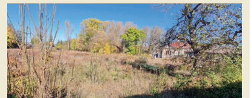
A másik új utca a Cebrián családról kapja a nevét.