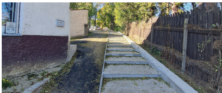
A gyalogos bejáratot a Közhasznú Szolgáltatások (VPS) dolgozói rekonstruálták.