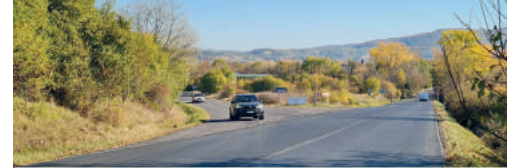
A nehezen belátható kereszteződésnél is javulnia kéne a forgalmi helyzetnek.

A munkálatokra Fülek város, valamint Síd, Csoma és Sőreg községek kataszterében kerül sor. Információink szerint a megye a projekt keretein belül teljes mértékben felújítja a Malom utcát, és megoldja az áttekinthetetlen közlekedési helyzetet is a temető melletti "V" kereszteződésben. „A települések lakott részein az út javítása a meglévő útburkolat lemarásából és az út új szerkezeti rétegeinek lerakásából áll, a rossz