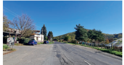
A Malom utca aszfaltozása is része a projektnek.