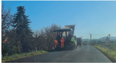
Több mint 6 km-es szakaszt újítottak fel Losonc irányában.

Ezekben a napokban fejeződik be az első osztályú út kiterjedt rekonstrukciója, amelyet sok füleki használ napi rendszerességgel. Amint Martin Guzi, a Szlovák Közúti Igazgatóság szóvivője tájékoztatott, új aszfaltburkolatot kapott az I/71-es út teljes szakasza Fülekkelesénytől a Füleket elkerülő főút végéig (Fülekpüspöki előtt). „Az aszfaltburkolat nagyarányú javításáról van szó, ami két rétegben történik. Georács felhasználásának segítségével megerősítik a lerakott aszfaltrétegeket. A javítást egy 6,56 km hosszú szakaszon hajtják végre” - pontosította a szóvivő kiegészítve még azzal, hogy a megvalósítás teljes költsége majdnem elérte a kétmillió eurót. Az építkezés kivitelezője a Združenie Stred Eurovia – Doprastav vállalati társulás. „A munkálatok mindkét irányban szabad sávban biztosított teljes forgalom mellett zajlanak. A forgalmat a munkavégzés ideje alatt a kivitelező felelős személyzete, illetve a technológiai szünetek ideje alatt jelzőlámpák szabályozzák.”