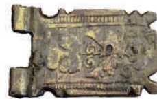
Knižné kovanie, 16.-17. stor.