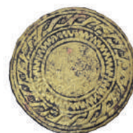
Ozdobné kovanie z remeňa.