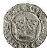
Strieborný denár zo 17. storočia - averz.