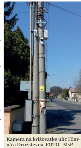
Kamera na križovatke ulíc Hlavná a Družstevná.

Mesto v marci úspešne zrealizovalo projekt v rámci výzvy Rady vlády SR pre prevenciu kriminality pre rok 2019. Vďaka nemu sa v meste podarilo umiestniť šesť nových statických kamier a vymeniť ďalšie dve otočné. Na projekt získali dotáciu vo výške 80 percent nákladov, mesto uhradilo zvyšných 20 percent. „Nové statické kamery boli zamerané