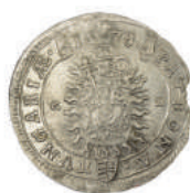
Mince z r. 1678 s portrétom Leopolda I. - reverz.