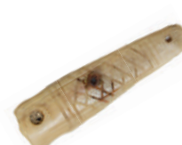
Zdobené kostené obloženie rúčky noža, 16.-17. stor.