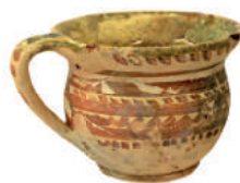
Hrček z konca 17. storočia.