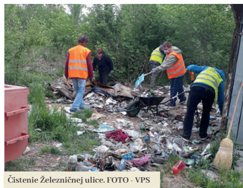
Čistenie Železničnej ulice.