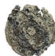
Textilná plomba z Anglicka.