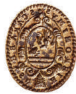
Pečatidlo Hieronyma Scara-bea.