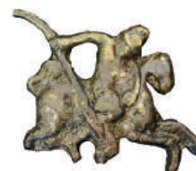
Ozdobné kovanie v tvare jazda.