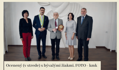
Ocenený (v strede) s bývalými žiakmi.