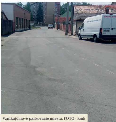
Vznikajú nové parkovacie miesta.