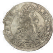
Mince z r. 1678 s portrétom Leopolda I. - averz.