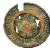
Kukučkovaný tanier z dolného hradu, 16.-17. stor.