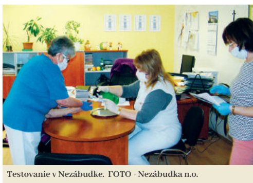
Testovanie v Nezábudke.

Výsledky všetkých potešili, zamestnanci aj klienti