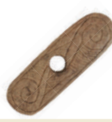
Ornamentálna kostená platnička na zdobenie pažby pušiek.