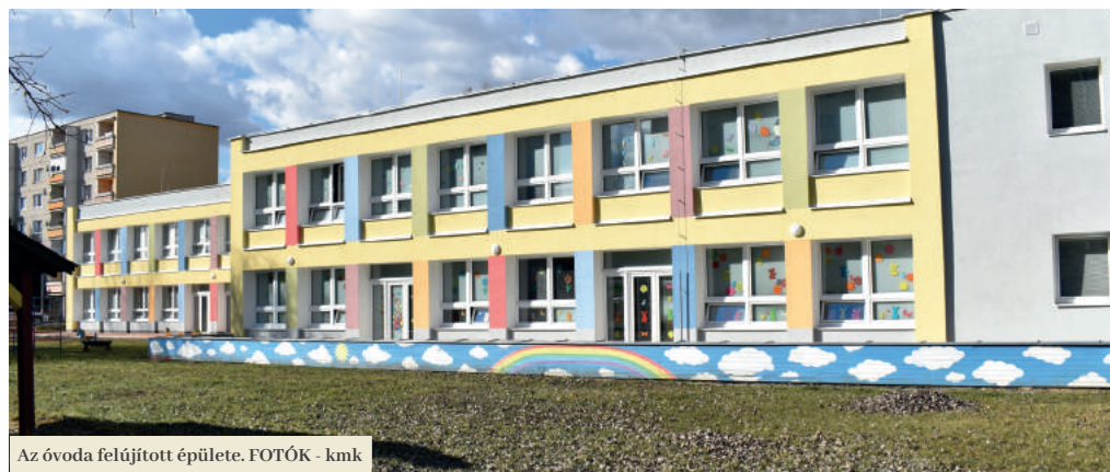
Az óvoda felújított épülete.

Nem indokolatlan a Daxner utcai óvodát látogató gyerekek öröme. Február 20-án átadták számukra az óvoda felújított épületét.