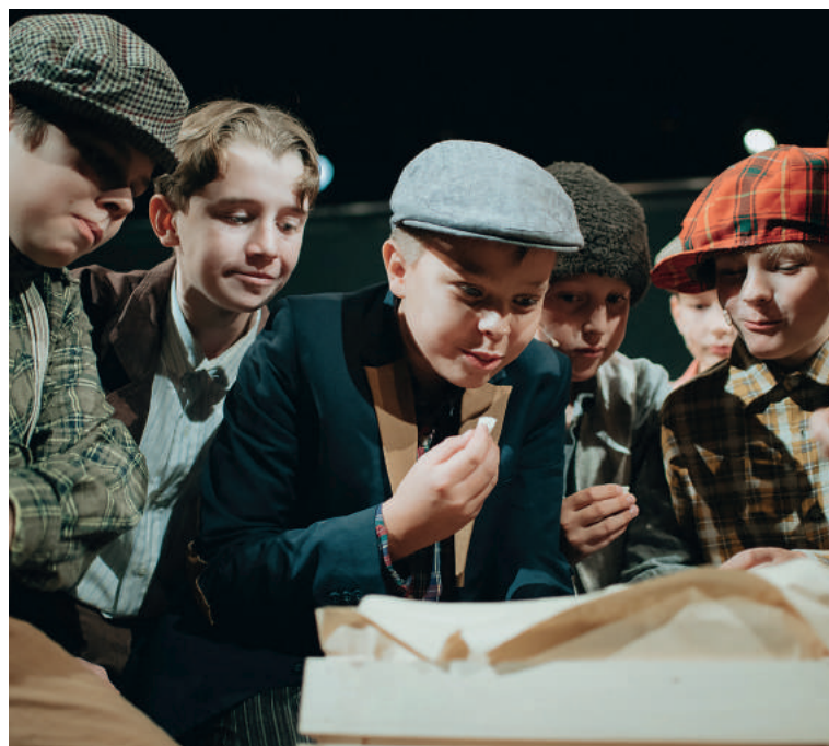
A Légy jó mindhalálig c. musical március 21-én a VMK-ban!