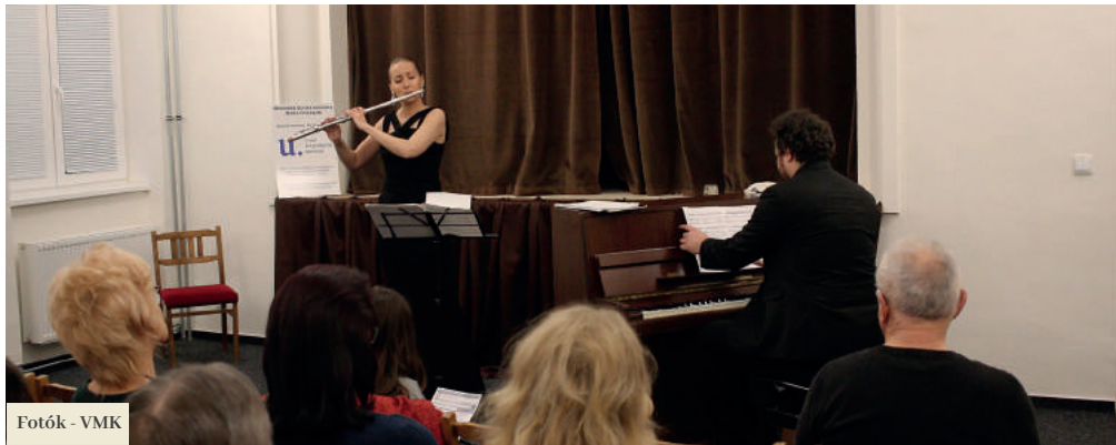
Fotók - VMK