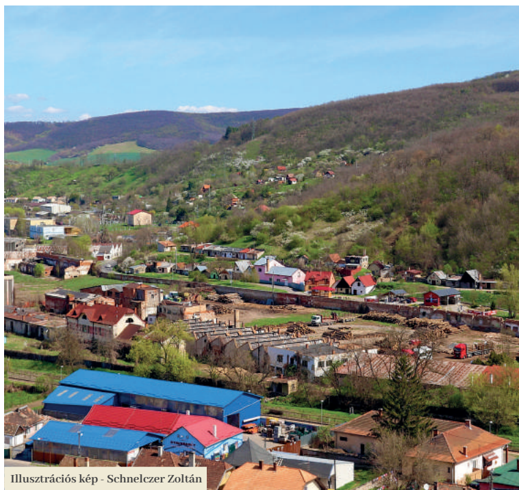
Illusztrációs kép - Schnelzer Zoltán