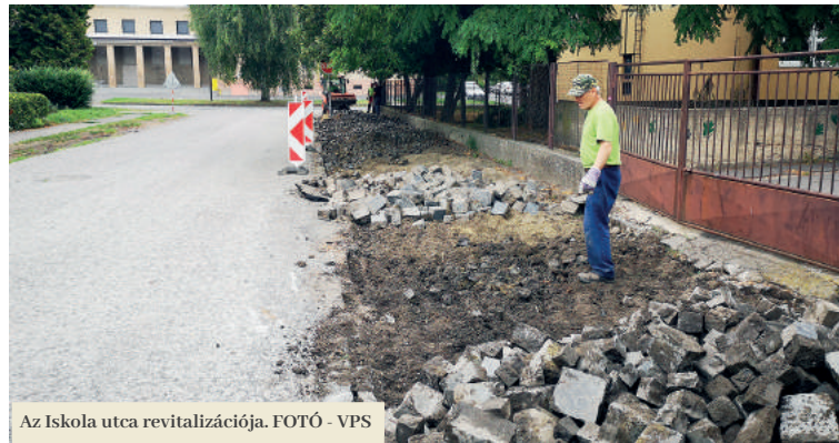
Az Iskola utca revitalizációja.

A járdák elújítása már július elején elindult. A Közhasznú Szolgáltatások (VPS) dolgozói elsőként a postaépület melletti járdát állították helyre. A járda régi burkolatát bazalt kockakövel helyettesítették. A munkálatok kiterjedtek az épület mögötti parkolóra is. A város kiadásai megközelítik a 15 ezer eurót. A továbbiakban a Fő utcának a Várfelső utcától a Bástyá utcáig terjedő szakasza kerül sorra, melyet szintén bazalt kockakövekkel raknak ki hozzávetőleg 4000 euróért.