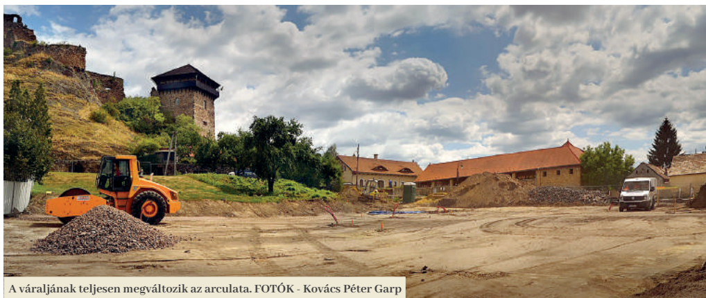
A váraljának teljesen megváltozik az arculata.

Sikeresen beindult az utóbbi évtizedek egyik legnagyobb projektje Füleken. A váralja komplex felújítása július első felétől kezdődött el, és novemberre várható a befejezése. A napokban a vár alatt egyidejűleg zajlik a projekt két szakasza, melyek a Bástya és Várfelső utcák, valamint a Gyári út részének felújítását és modernizálását, valamint a személykocsiknak és turistabuszoknak szolgáló parkoló és a nyilvános illemhely megépítését foglalják magukban. A projekt harmadik része, amely a vár alatti kis bástyát, a Bebek-tornyot, az ágyúbástyát és a borházat érinti, augusztusban veszi kezdetét.