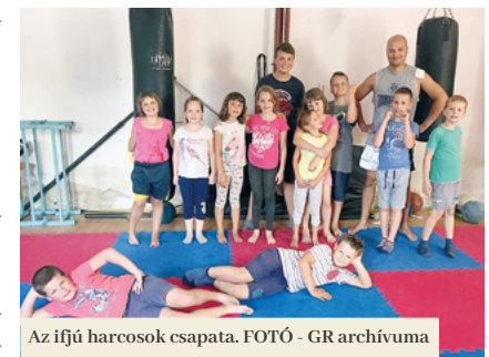
Az ifjú harcosok csapata.

Kezdetben foglalkozott minden korosztály edzésével, majd az utóbbi évben úgy döntött, hogy csak a 6 és 18 év közötti gyermekek és tizenévesek tanítását vállalja. „Jelenleg mintegy tizenöt tanoncom van. Néhány gyermeknél egy idő után alább esett a kezdeti lelkesedés és nem folytatták az edzést. Idővel viszont kialakult egy erős mag, amelyre építeni lehet. Ez főként a megfelelő információterjesztésnek köszönhető, mert a szülők ma már tudják,