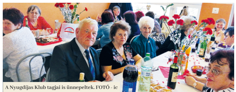
A Nyugdíjas Klub tagjai is ünnepeltek.