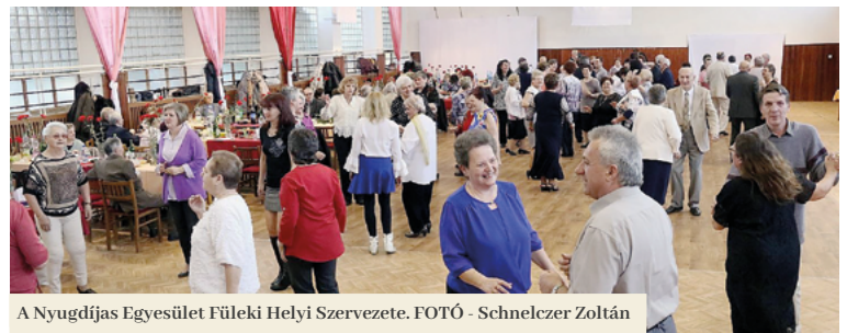
A Nyugdíjas Egyesület Füleki Helyi Szervezete.