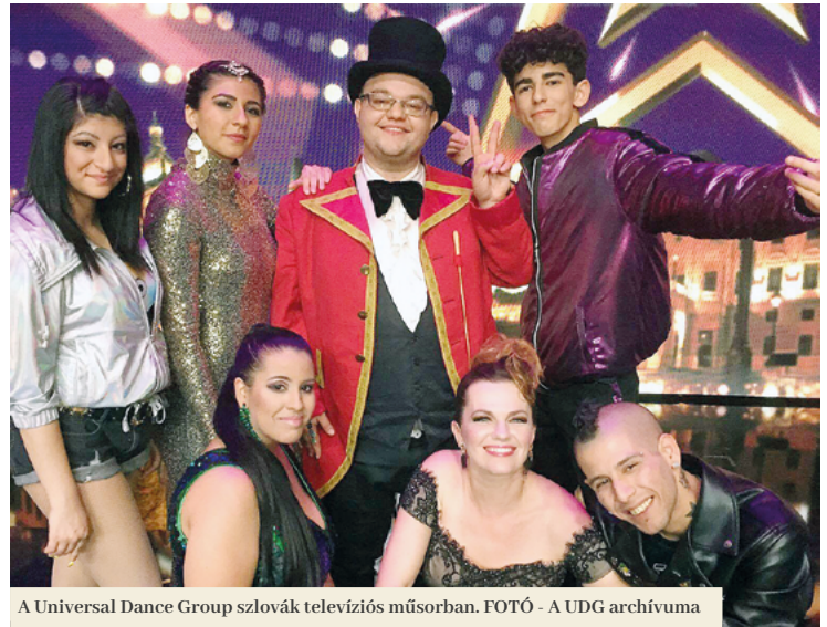
A Universal Dance Group szlovák televíziós műsorban.

Ebbe a tehetségkutató műsorba azért jelentkeztünk, mert szerettünk volna visszacsatolást kapni arról, hogy fejlődöttünk-e az évek során annyit, hogy akár 100 ezer produkcióból beválaszszanak a 9, döntős produkció közé. Az első casting Rimaszombatban volt, innen továbbjutottunk a pozsonyi fordulóba, ahol már a 4 zsűritag előtt