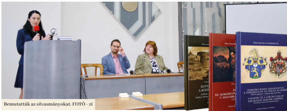
Bemutatták az olvasmányokat. FOTÓ - zi

A Füleki Vármúzeum február végén mutat be a nyilvánosságnak két új kiadványát. Mindkettő tartalmas információkkal szolgál városunk és a térség történetét illetően, úgy a szakmai, mint a nagyközönség számára.