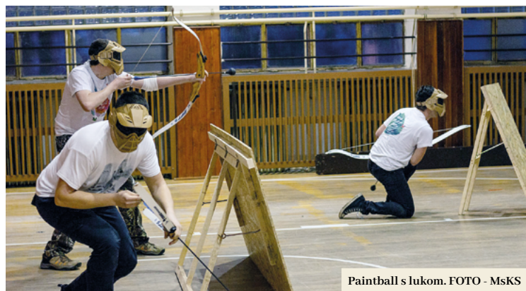
Paintball s lukom.