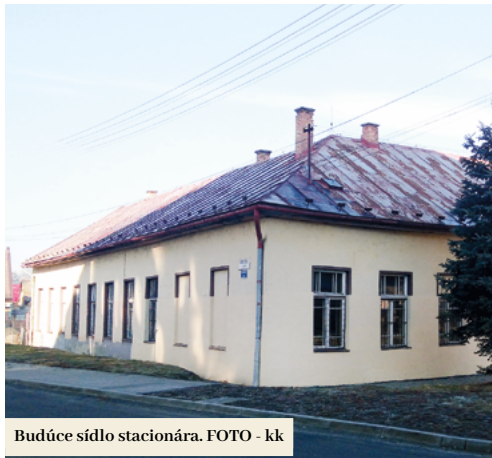
Budúce sídlo stacionára.