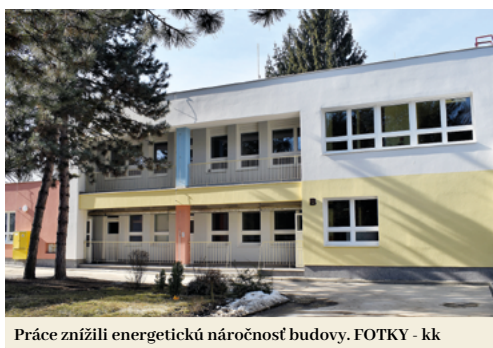
Práce znížili energetickú náročnosť budovy.

Z týchto peňazí sa podarilo znížiť energetickú náročnosť budovy – zateplili sa fasáda aj strecha, vymenili sa všetky okná a dvere a vyriešil sa aj problém s teplou vodou. V škôlke pribudol, namiesto 16-tich osobitných bojlerov, centrálny systém na ohrev vody. Okrem spomínaných prác sa ďalej obnovili všetky sociálne zariadenia, zamuroval sa jeden balkón a pribudla nová prístavba. Vďaka nej sa podarilo navýšiť kapacitu škôlky na súčasných 154, teda o 15 nových miest. Spolu s rozšírením kapacity v MŠ na Daxnerovej ulici tak v poslednom období v meste pribudlo 35 nových miest pre deti. Rozširovanie kapacít má pomôcť aj pri zavedení povinnej