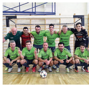
Balex Trade Team.