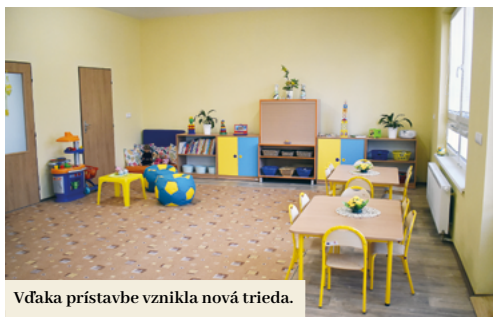
Vďaka prístavbe vznikla nová trieda.