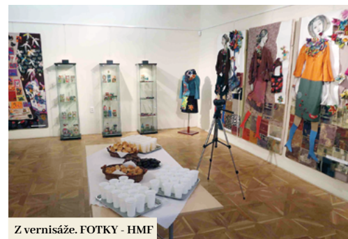
Z vernisáže.

z ktorých sme zabezpečovali hlavne netradičný a ťažko zohľaditeľný materiál- plst, rôzne farby na sklo alebo textil, ihly, nite a ďalšie drobnosti,“ povedal riaditeľ s tým, že niektoré materiály doniesli aj samotní účastníci. „Počas siedmich tvorivých stretnutí tu vznikli stovky malých i väčších diel, ktoré sme museli ukázať svetu. Keďže záujem o tvorivé dielne prekročil 100 účastníkov, určite ho v budúcnosti zopakujeme a ponúkneme ešte aj ďalšie tradičné techniky z minulosti,“ uzavrel.