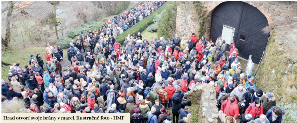
Hrad otvorí svoje brány v marci.