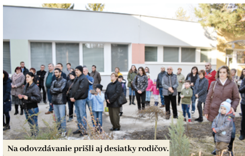
Na odovzdávanie prišli aj desiatky rodičov.