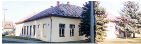
A nappali ellátó a művészeti alapiskola egykori épületében kapna helyet.