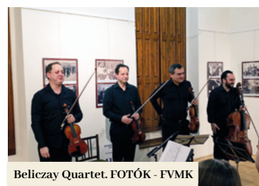
Beliczay Quartet.