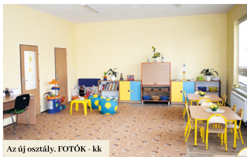
Az új osztály.