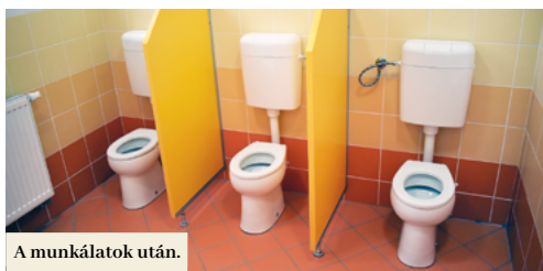
A munkálatok után.