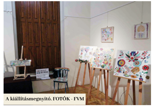
A kiállításmegnyitónapján.

A projekt sikerességéről elismerően nyilatkozott az MAI igazgatója, Ardamica Zorán is: „Iskolánk megalakulásának 65. évfordulóját a kreativitás kibontakoztatásával szeretnénk volna megünnepelni. A szülők, a diákok és a nyilvánosság számára rendezett koncerteken kívül a képzeletre és a művészet vizuális észlelésére is hangsúlyt fektettünk. A projektre négyezer euró anyagi támogatást kaptunk, melyből főleg a különleges és