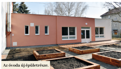
Az óvoda új épületrésze.

Befejeződött a Štúr utcai óvoda felújítása. A gyermekek, pedagógusok és a szülők is örömeiket lelik a megújult épületben, melybe a város 726 ezer eurót ruházott be. Ez az összeg több forrásból származik. Az Integrált Regionális Operatív Programból a városnak 428 ezer eurót sikerült lehívnia, a kormány a kihelyezett ülése során 57 ezer euró összegű speciális támogatással járult ehhez hozzá, 170 ezret a város egy nagyobb hitelből határolt el, 46 ezret pedig a saját költségvetéséből pótolta. A Filbyt városi cég egyidejűleg rekonstruálta az óvoda kazánházát több mint 25 ezer euróért. Ebből a pénzből sikerült csökkenteni az épület energiaigényességét – hőszigetelve lett a homlokzat és a tető, megtörtént az épület teljes nyílászáró cseréje, és megoldódott a melegvíz-probléma is. Az óvoda eddigi 16 különálló bojlerét központi vízmelegítő rendszerrel helyettesítették. A kazánház említett átépítésén kívül megújult az összes szociális helyiség is, befalaztak egy teraszt, és új épületrésszel bővült az óvoda. Ennek köszönhetően sikerült az óvoda befogadóképességét 154-re, vagyis 15 új férőhellyel növelni. A Daxner utcai óvodában történt kapacitásnöveléssel együtt így a városban a gyermekek részére 35 új hely lett kialakítva. A kapacitásnövelés segítséget jelent majd az 5 éves gyerekek kötelező óvodalátogatásának biztosításában, amely