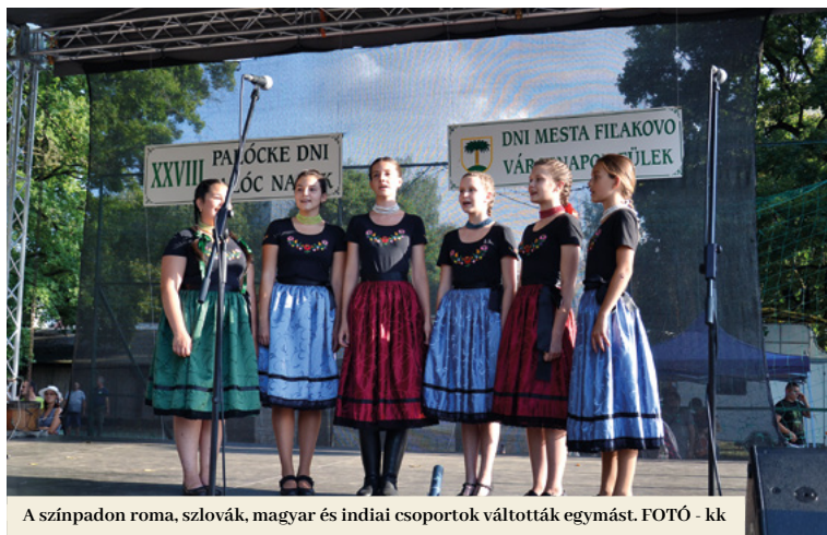
A színpadon roma, szlovák, magyar és indiai csoportok váltották egymást.