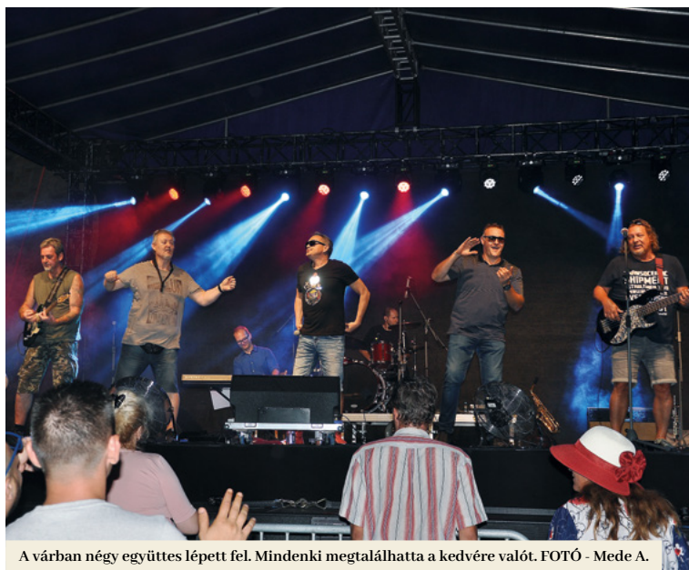
A váriban négy együttes lépett fel. Mindenki megtalálhatta a kedvére valót.