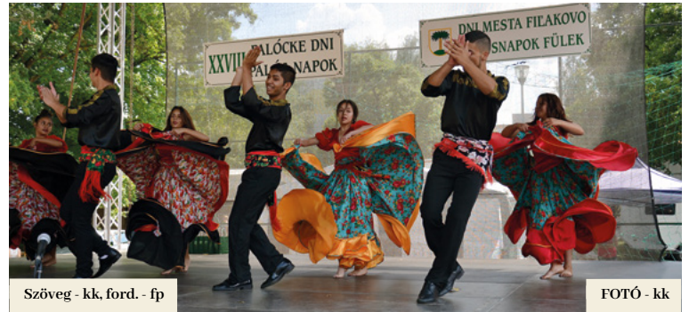
Szöveg - kk, ford. - fp