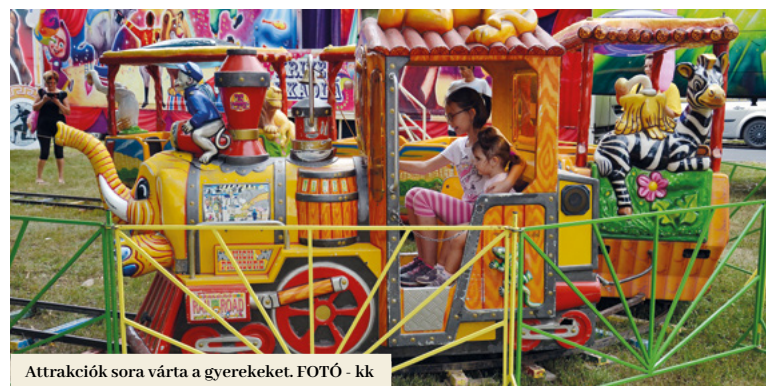
Attrakciók sora várta a gyerekeket.