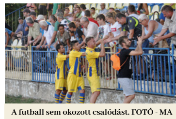
A futball sem okozott csalódást.