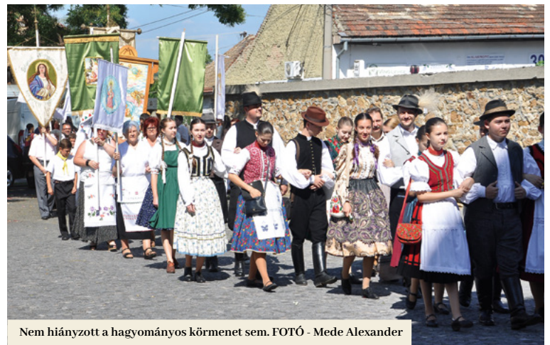
Nem hiányzott a hagyományos körmenet sem.