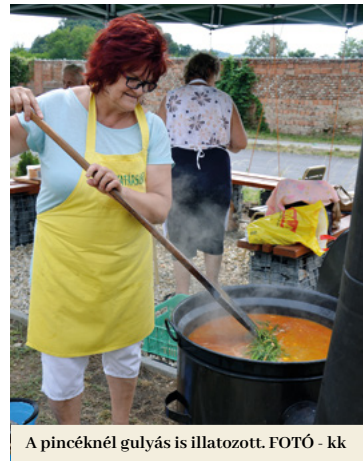
A pincéknél gulyás is illatozott.