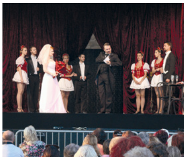
Hab a tortán – Csárdáskirálynő.