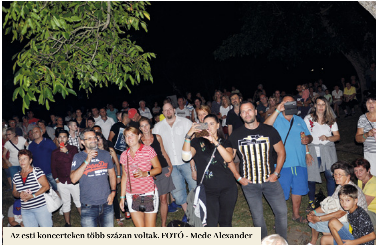
Az esti koncerteken több százan voltak.