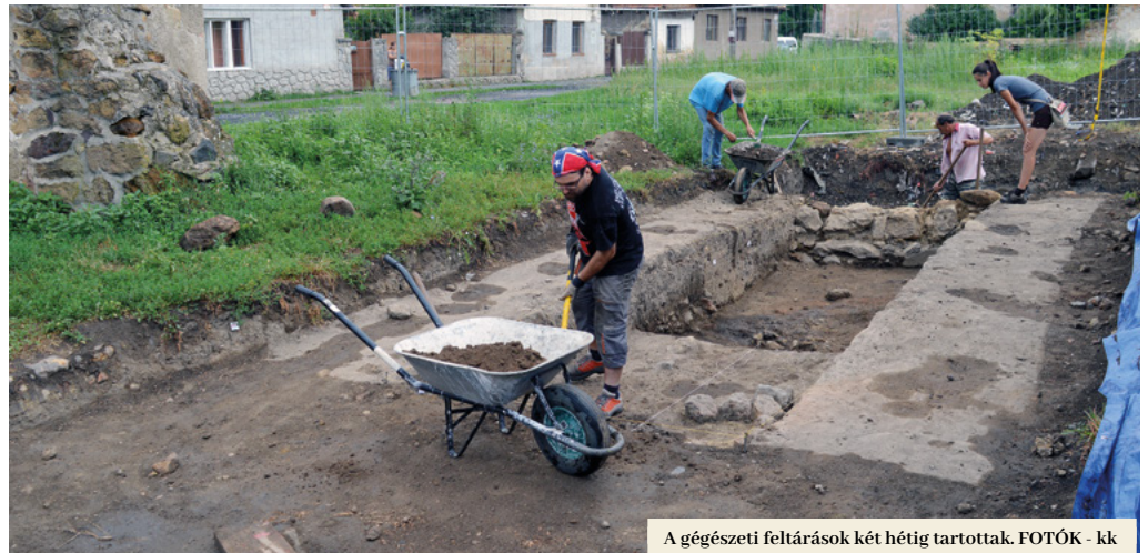
A régészeti feltárások két hétig tartottak.

ük, hogy itt őskori rétegre is bukkanhatunk.” Amint azt tovább elmondta, a feltárást már az első nap meghozta a gyümölcsét. „Többek között különlegesnek számító tárgyakat is találtunk itt, például olyan