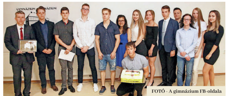
FOTÓ - A gimnázium FB-oldala

Az utolsó júniusi péntek a Füleki Gimnáziumban más volt, mint a többi iskolában. A bizonyítványokon kívül a legsikeresebb diákoknak immár tizedik alkalommal osztották ki a Talentum Díjakat. Az ünnepségen ezúttal nemcsak a tanulók, az iskola és az e-Talentum nonprofit szervezet képviselői vettek részt, hanem Ján Lunter megyeelnök, Pavol Baculík megyei képviselő és Agócs Attila, a város polgármestere is. „A gimnáziumok tanulói jelentik a jövő értelmiségét, ezért ezek az iskolák nagyon fontosak. Örülök, hogy ma részt vehettem ezen a jeles napon” – mondta a megyeelnök.