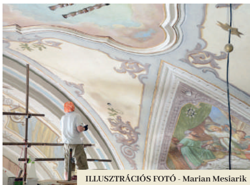
ILLUSZTRÁCIÓS FOTÓ - Marian Mesiarik

Amint azt Jakub barát, a kolostor elöljárója elmondta, a templom belterében 2015-től folyamatosan folynak a restaurálási munkák. Elsőnek a presbitérium újult meg, majd a kórus következett, később pedig a templomhajó hátsó és középső részét is restaurálták. A munkák ez ében is folytatódnak. Néhány hét múlva már ismét az állványokra kellene állniuk a restaurátoroknak. A ferencesek INTERREG határon átnyúló pályázata sikeres lett, és a magyar oldallal közösen közel három millió