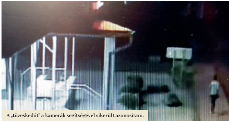
A „tüzeskedőt” a kamerák segítségével sikerült azonosítani.

A füleki városi rendőrök mozgalmas negyedévet tudhatnak maguk után. Hogy nemcsak a bírságolás a dolguk, azt bizonyítja a májusi hónap, melynek során a segítségükkel sikerült tolvajokat és egy rendbontót is leleplezni, bizonyítékul pedig a kamerák és fotócsapdák felvételei szolgáltattak.