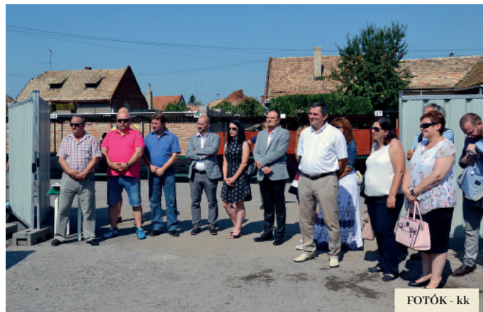
FOTÓK - kk

is helyet kap benne. A piacra mindkét irányból, a Koháry tér és a Piac utca felől is, akadálymentesített hozzáférés lesz biztosítva.