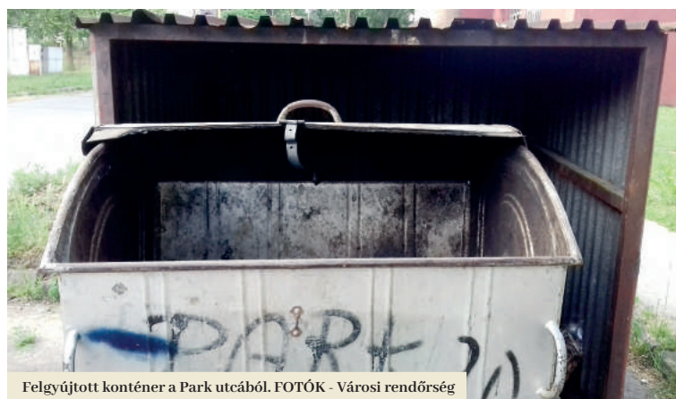
Felgyújtott konténer a Park utcából.