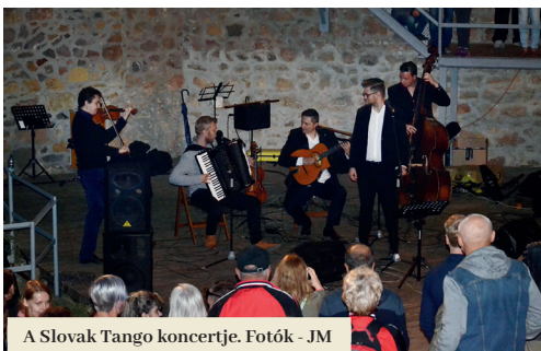
A Slovak Tango koncertje.