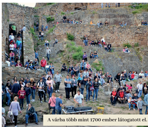
A várba több mint 1700 ember látogatott el.

A program a vár művészi kivitelezésű új díszkapujának átadásával folytatódott. Az évad legvárhatóbb attrakciója a várhegy föld alatti légoltalmi óvóhelyeinek megnyitása volt. Bennük „Fülek 1938 – 1945” címmel nyílt állandó kiállítás, amely a város második világháború alatti eseményeit dokumentálja (a kiállításról részletesebb információk a 4. oldalon olvashatók – a szerk. megjegyzése). Az óvóhelyek megnyitását követően a látogatók a Bebek-torony ötödik emeletén a „Gésa és samuráj” című kiállításban gyönyörködhetnek. A prágai Nemzeti Múzeum alá