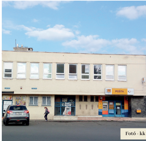
Fotó - kk

Véleménye szerint a hivatal helyiségei teljes rekonstrukción mennek keresztül, amelynek köszönhetően átszerveződnek, és így egy 8 ablakos ügyfélfogadási pulttal rendelkező új postacsarnok alakul majd ki. „A felújítás magában foglalja a következőket: az építési és bontó munkálatok, talajmunkák, alapozás, függőleges és vízszintes felújítás, szigetelés, asztalosmunkák, padlózás, csempézés, bevonatok felvitele, festés – csaptelepek, központi fűtés, világítástechnika kábelezése, szellőztető rendszer, kifesztyűs vezetékek és az objektum tűzvédelmi biztonsági rendszere” – sorolta fel. A tető