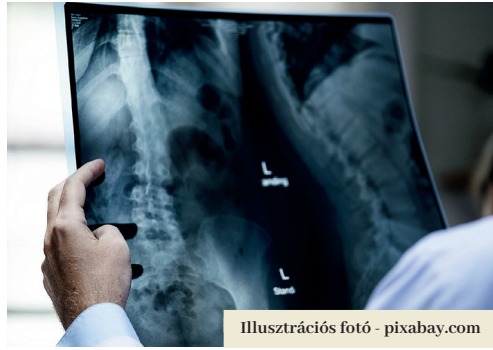
Illusztrációs fotó - pixabay.com

Besztercebánya Megye Önkormányzati Hivatalának egészségügyi részlege szerint a mikrorégióban 32 egészségügyi ellátás nyújtására jogosult alany van. Az önkormányzat a projekten belüli együttműködés javaslatával fordult mindegyikük-höz. „Közülük eddig 11 orvos nyilatkozott kedvezően, hat elutasította, a többiek pedig nem reagáltak a kérelmünkre” – mondta, hozzátéve, hogy az együttműködési javaslattal sikerült előzetesen az általános orvosok, de az olyan szakorvosok érdeklődését is felkelteni, amilyeneknek a felhívás alapján az IEÜK projektben kötelezően szerepelniük kell. „Rajtuk kívül például a neurológusét, ortopédusét, urológusét, stb.”