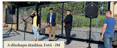
A díszkapu átadása.