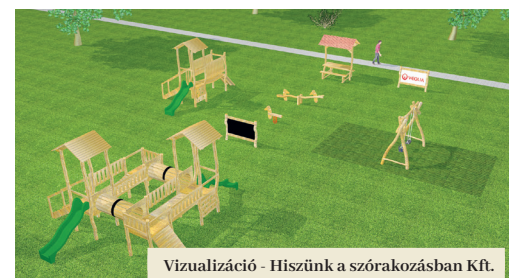
Vizualizáció - Hiszünk a szórakozásban Kft.