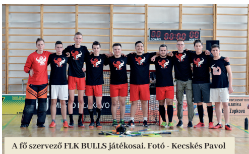
A fő szervező FLK BULLS játékosai.

A nézők megtekinthették a csoportmérkőzéseket, amelyeket az elődöntők követtek, ahol a döntőbe jutás és a harmadik helyezés volt a tét. A kiegyenlített és az előre nem látható mérkőzések után a harmadik helyezést a szervező FLK BULLS