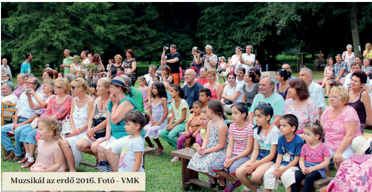
Muzsikál az erdő 2016.

Zenével telik meg június utolsó szombatján a városi park Füleken. A „Muzsikál az erdő” többéves hagyományokkal rendelkező mátrai rendezvény, mely két évente átnyúlik a határon, és június 30-i nyitónapjának helyszíne ismét Fülek lesz. A városi park lombkoronái alatt koncertezik majd a „Zem spieva” televíziós műsorból ismert ruszin zenekar, a Rusín Čendes Orchestra, dalra fakad a helyi Melódia Női Kar és a Vox Mirabilis Kórus Székesfehérvárról, fellép a Tari Kontyvirág Néptáncegyüttes, bemutatkozik a füleki Foncsik Énekegyüttes, s hangversenyt ad az Egri Szimfonikus Zenekar is.