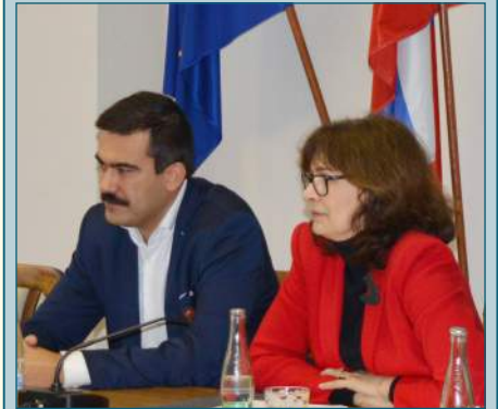
Lucia Žitňanská, ministerka spravodlivosti s primátorom mesta