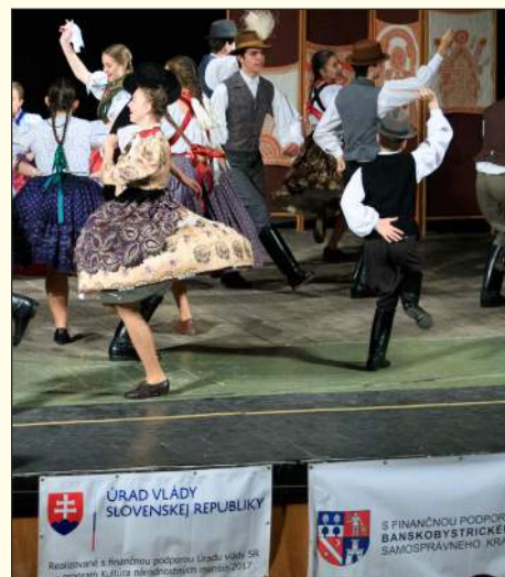
Celovečerný program FS Rakonca a jeho hostí

Naplnenie horeuvedených aktivít by bolo nemyšliteľné bez finančnej podpory Mestského kultúrneho strediska vo Filakove, Úradu vlády SR a Banskobystrického samosprávneho kraja, ktorým chceme aj touto cestou vyjadriť naše poďakovanie. V mene 60 tanečníkov súboru prajeme príjemné prežitie vianočných sviatkov všetkým rodičom, bývalým tanečníkom a priaznivcom folklóru.