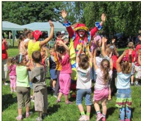
Mesekocsi Színház: Nyárindító fergeteg

Meseszínház, ügyességi játékok, kézműves foglalkozások, sportjátékok, arcfestés és sok más érdekesség vár a kicsikre a Városi Gyermeknapon június 4-én, Füleken. A városi parkban délelőtt 10 órától húsz állomáson próbálhatják ki ügyességüket a gyerekek a helyi alapiskolák és óvodák, a Közösségi Központ, valamint a füleki cserkészcsapat és a Helen Doron Nyelviskola jóvoltából. A déli órákban rendőrségi és katonai bemutatókkal kedveskednek a szervezők az érdeklődő gyerekeknek, akik így közelebbről is megtekinthetik a rendőrségi fegyvereket, kipróbálhatják a rendőrautót, valamint találkozhatnak a légierő katonáival. A színpadon kettőkor kezdődik a Mesekocsi Színház Nyárindító fergeteg című műsora. A vidám, zenés, interaktív előadásban bohóc, bűvész, és bábművész varázsolja el a gyerekeket dalokkal, bűvésztrükkökkel, játékokkal – mindezt megannyi mozgással és nevetéssel fűszerezve. A zárókoncert előtt tűzoltóbemutatóra invitálják a kicsiket a