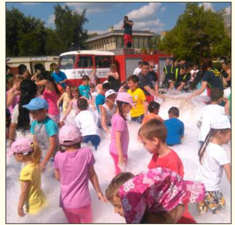
Idén is lesz habparti az önkéntes tűzoltók jóvoltából

helyi tűzoltóegyesület önkéntesei: a tűzoltóautó és -felszerelés megtekintésén túl valódi tűzoltásnak is szemtanúi lehetnek, a kifejezetten számukra fújandó tűzol-