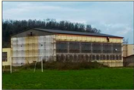
A papréti tornaterem új nyeregtetővel és felújított parkettel

Az elmúlt évben mindkét óvodánkra kidolgoztuk és benyújtottuk a kapacitásbővítésüket megcélzó pályázatokat. A Daxner utcai óvoda pályázata 58.000 eurós támogatást nyert az Oktatásügyi Minisztérium vonatkozó pályázati programjában, melynek segítségével a 2016-os nyári szünet alatt beépítésre kerül az utca felé néző emeleti terasz, ami további 20 gyermek óvodai elhelyezésére ad majd lehetőséget a következő tanévtől. Az utca felőli épületblokk ablakcseréjére a város 2016-os költségvetésében különítettünk el anyagi fedezetet, a távolabbi épület energiatárolásának növelésére a Környezetvédelmi Minisztériumhoz nyújtottunk be pályázatot, melynek elbírálása tavaszra várható. A Sűr utcai óvoda komplex felújításának megtervezésére szükséges pénzkérdetet a mintegy évtizedes várakozás után szintén a jövő évi városi költségvetésben hagyta jóvá a képviselő-testület. Hasonlóképpen a kisgyermekes családok régi kövételére reagáltunk, amikor az Ifjúság utcai ját-