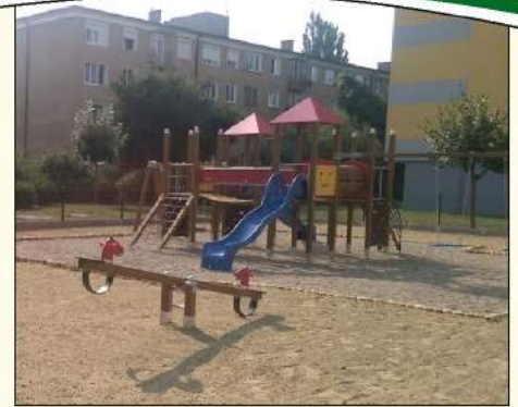
A felújított Ifjúság utcai játszótér

Amint arról az előző pontban is szóltunk, a szabadidőközpont tevékenységeinek a VMK-hoz (valamint a papréti szlovák alapiskolához) való átsorolásával és az intézmény keretei között működő csoportok, zenei formációk felkarolásával befejeződött a kulturális intézményrendszer korábbi években megkezdett reformja, amely a városban élő nemzeti/nemzetiségi közösségek kulturális igényeit is igyekezett figyelembe venni. Így egy tető alá kerültek a hagyományos magyar csoportok (Pro Kultúra, Melódia, Rakonca, Kis Rakonca, Zsákszínház), a szlovák néptáncgyűttesek (Jánošík NE, Jánošík GYNE), és az egykori Klub épületében kapott helyet a roma Közösségi Központ is. A civil szervezeti szinten működtetett kultúra finanszírozásának egyszerűsítését és átláthatóbbá tételét volt hivatott szolgálni a Civil Alapra vonatkozó kötelező érvényű rendeletünk módosítása. A VMK komplex felújításának megtervezésére a jövő évi költségvetésben a testület több mint 25.000 eurót hagyott jóvá. Miközben 2017