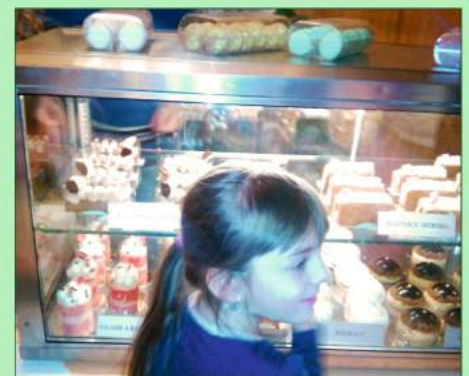
A salgótarjáni Kézműves Cukrászat „alkotásai”