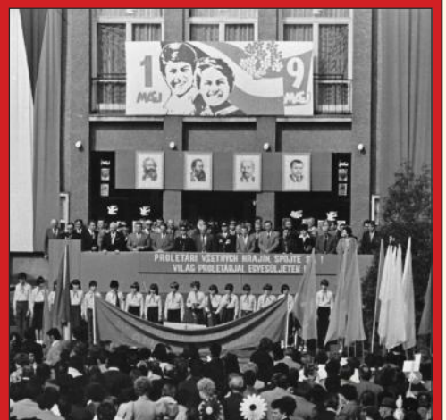
Prvomájové oslavy pred Závodným klubom