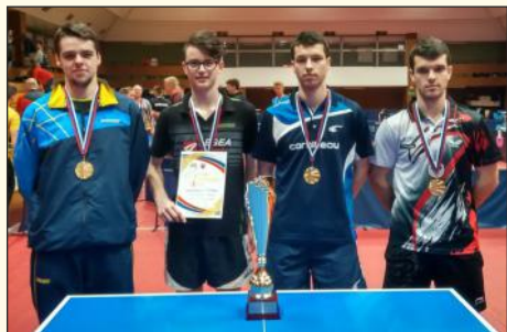
Majstri Slovenska v stolnom tenise v roku 2016

Čas Vianoc nie je len o darčekom a každodennom zhone, ale aj časom obzretia sa a bilančovania. Toto je moment, ktorý je dôležitý v živote každej organizácie, teda aj nášho Gymnázia – Gimnázia vo Filakove. Čo nám teda priniesol uplynulý rok? Škola vstupovala do školského roka 2015/2016 po splnení veľkého projektu EÚ s názvom „Úspech nosíme v sebe“. Vďaka nemu sme modernizovali naše laboratória biológie, chémie, fyziky a informatiky. Naši pedagógovia