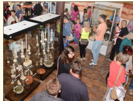
Vernisáž výstavy Grécko na úsvite dejín