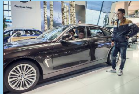
V mnichove pomocou projektu Erasmus

Existujúcu stolársku dielňu vybaviť modernými univerzálnymi drevospracujúcimi strojmi a zariadeniami. Absolventi trojročných učebných odborov získajú výučné listy a absolventi štvorročných študijných odborov maturitné vysvedčenie. Ich uplatnenie sa na pracovnom trhu bude prakticky neobmedzené. Budú sa môcť zamestnať po celom Slovensku, aj v okolitých závodoch, keďže po odborníkoch v strojárskom a elektropriemysle je veľký dopyt a už teraz im ponúkajú nadštandardné finančné podmienky, ktoré v blízkej budúcnosti budú ešte lukratívnejšie.