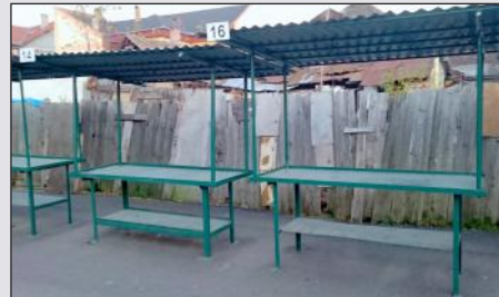
„...z Trhovej ulice zmiznú nevkusné železné stánky“

Vo dvore tak vznikne veľký prístrešok z drevenej konštrukcie s priestorom pre približne 36 predajcov. Dvor bude prechodný, čím sa prepojí Trhová ulica s Koháryho námestím. K dispozícii